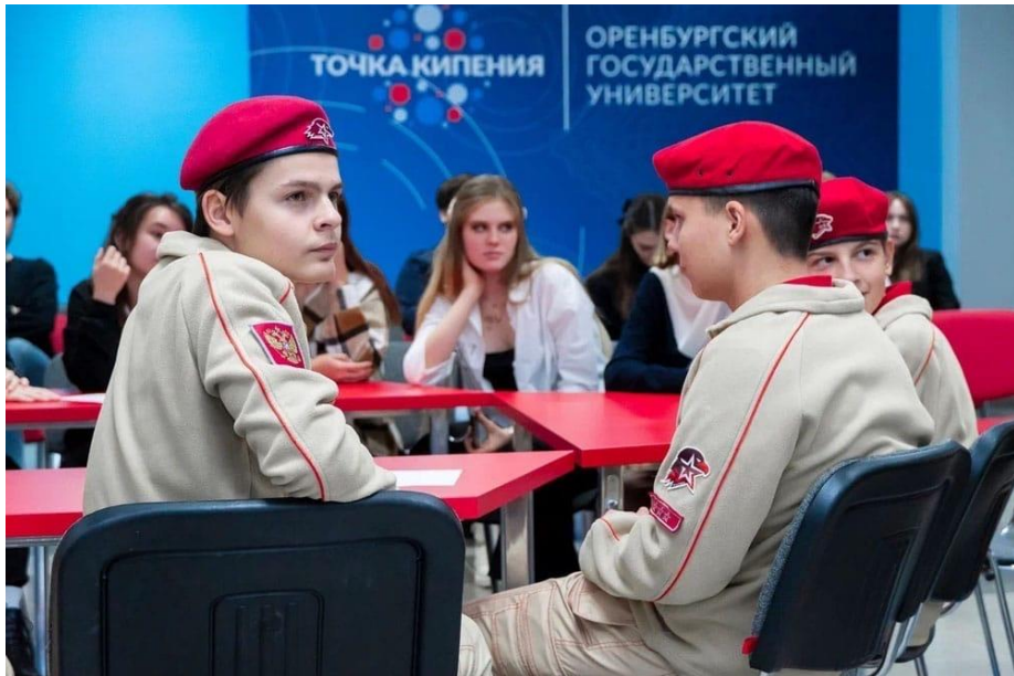
Регулярные мероприятия для юнармейцев города, проводимые активистами студенческого патриотического клуба «Я горжусь ОГУ».