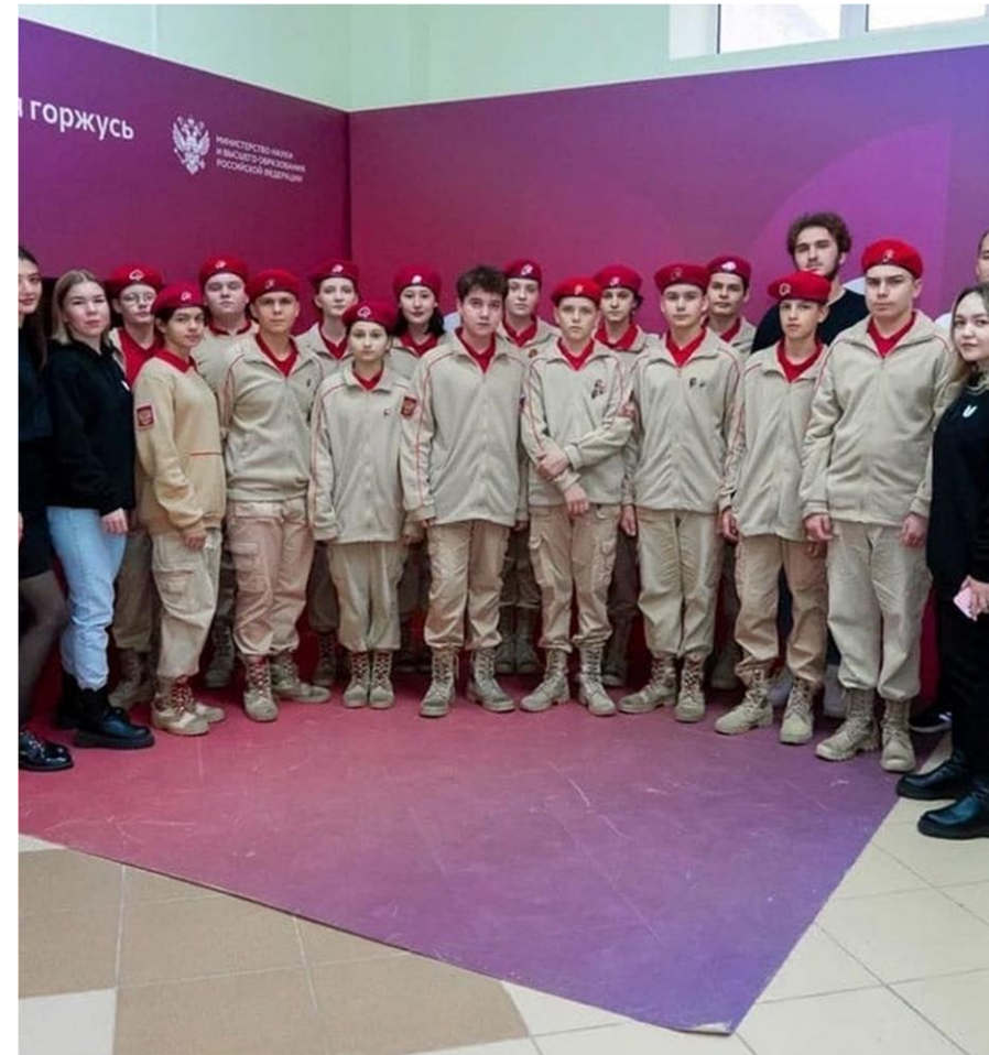
* Встречи с юнармейцами, Оренбург, 2022 г.

Важно заинтересовать школьников, вызвать у них неподдельные эмоции, ответную реакцию, которая подтолкнет их к дальнейшему изучению исторических событий.