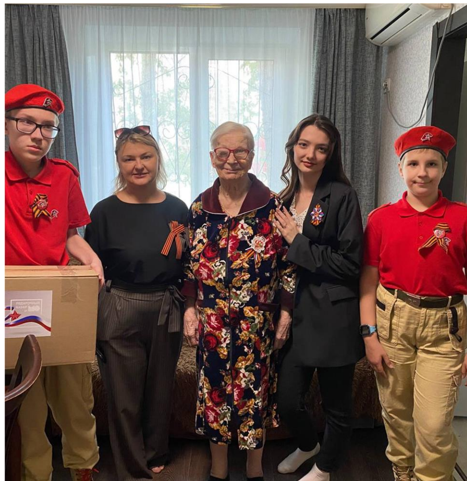
* Поездки к ветеранам 2021-2023 гг.